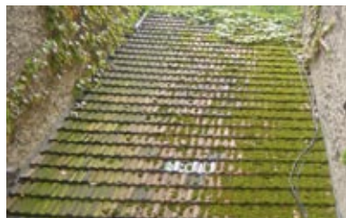
Vor der Oberflächenreinigung