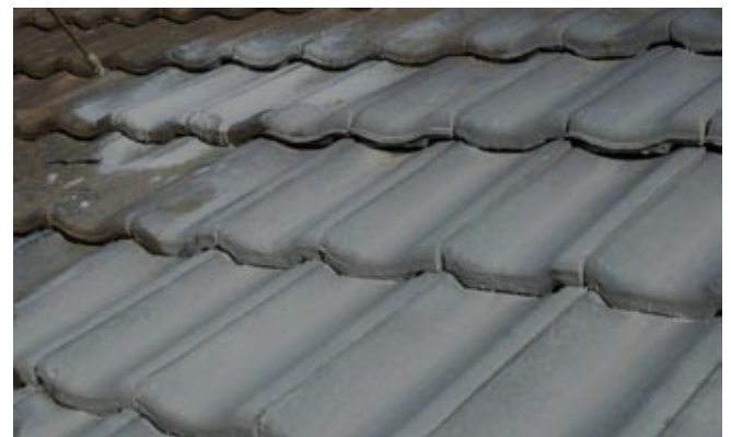
Aufspritzen der Dachbeschichtung