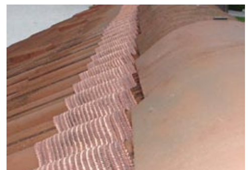
MOOSfree unterhalb First

MOOSfree 170 für Dachflächen mit Sparrenlänge bis 15 m.