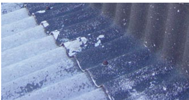
Beschädigte Oberfläche bei Faserzement-Wellplatten